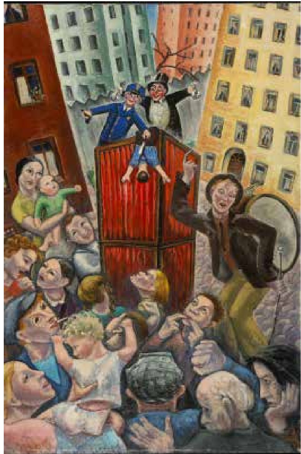
Paraskeva Clark, Petroushka , 1937, oil on canvas, National Gallery of Canada, Ottawa, purchased 1976, Photo: NGC, © Estate of Paraskeva Clark / Huile sur toile, Musée des beaux-arts du Canada, Ottawa, achat, 1976, Photo : MBAC, © Succession Paraskeva Clark

Les « cadeaux » dans le titre de cette œuvre sont ceux que Paraskeva Clark avait reçus du médecin et socialiste canadien Norman Bethune, son ami et amant occasionnel alors engagé dans la guerre civile espagnole. Peinte la même année que son célèbre tableau Petroushka (dans lequel l’artiste Elizabeth Wyn Wood est représentée avec son bébé dans le registre supérieur à gauche assistant à une manifestation politique avec un air bienveillant quasi satirique), cette aquarelle témoigne de l’ardeur des convictions gauchistes de Clark.