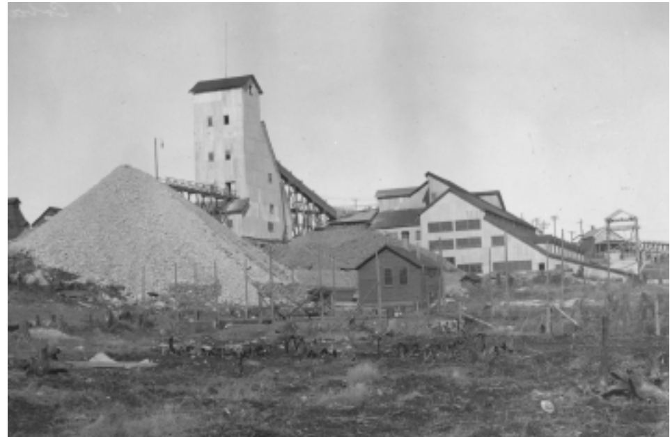
Coniagas Mine—Headframe and Mill, Cobalt, Ontario, n.d., Natural Resources Canada fonds, Library and Archives Canada, a017810 / Chevalement et puits de la mine Coniagas, Cobalt, Ontario, s.d., Fonds Ressources naturelles du Canada, Bibliothèque et Archives Canada, a017810

Cette œuvre a été présentée dans le cadre de l’exposition annuelle de l’Ontario Society of Artists en 1931, mais elle n’a pas trouvé preneur. Selon la famille, un collègue masculin du Musée des beaux-arts du Canada aurait conseillé à McKague Housser d’égayer sa palette. Ses représentations ultérieures de Cobalt sont plus colorées et plus animées, proposant une vision moins réaliste de l’industrie dans le nord de l’Ontario.