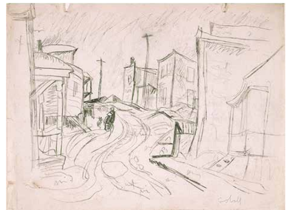
A.Y. Jackson, Cobalt , graphite on paper, McMichael Canadian Art Collection, Gift of the artist, 1974, 1974.7.191 / mine de plomb sur papier. Collection McMichael d'art canadien; don de l'artiste, 1974, 1974.7.191