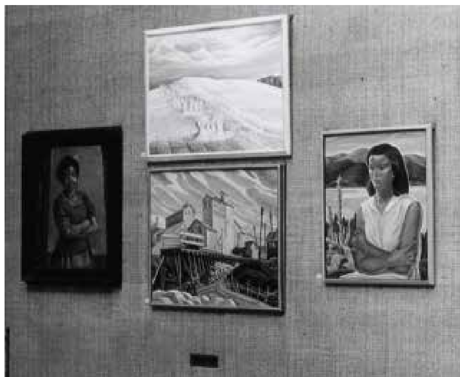
Installation view, A Century of Canadian Art, room 10, Tate Gallery, London, UK, 1938, National Gallery of Canada, Ottawa, EX-0288, / Vue d'installation de l'exposition A Century of Canadian Art, salle 10, Tate Gallery, Londres, 1938, Musée des beaux-arts du Canada, Ottawa, EX-0288